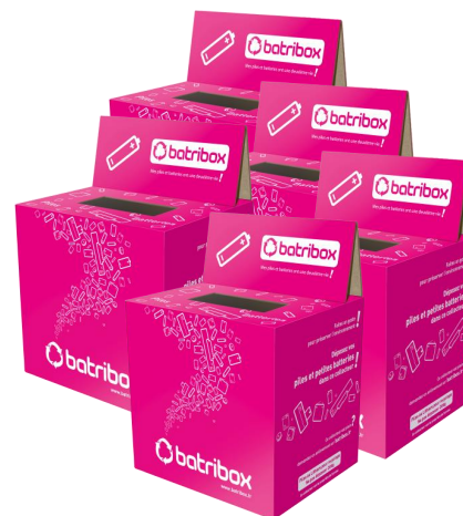
Cartons Batribox (20 kg/collecteur)