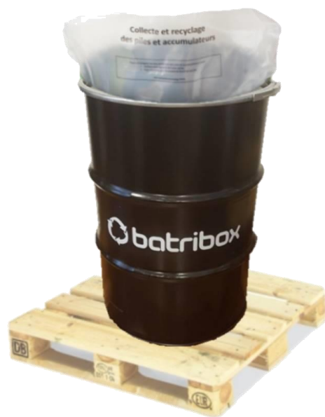
Fût Batribox (200L) avec sache plastique