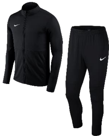
NOIR / NOIR