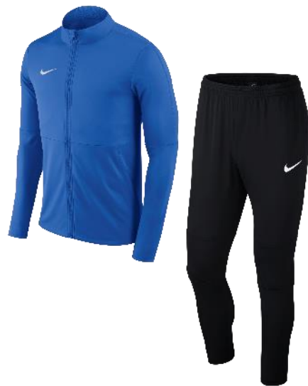
ROYAL / NOIR