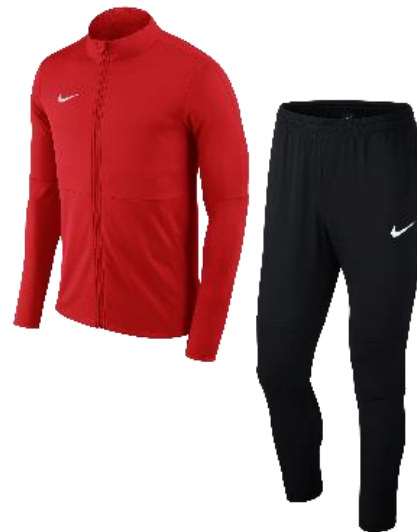
ROUGE / NOIR