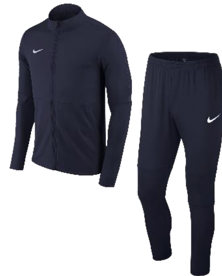
NAVY / NAVY