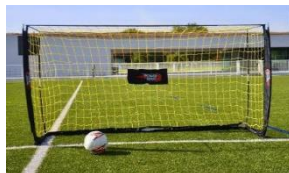
Paire de mini-buts