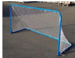
Paire de buts mobiles